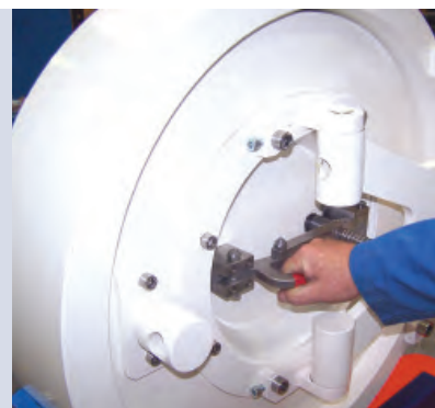
Открытие дверцы запорного устройства